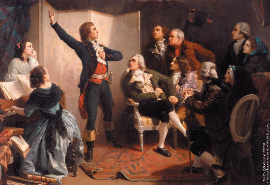
Pl/c Rouget de Lisle (détail)