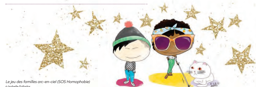
Le jeu des familles arc-en-ciel (SOS Homophobie)